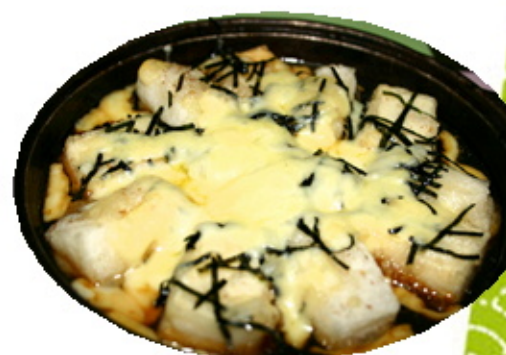
* 豆腐と餅のチーズ焼き